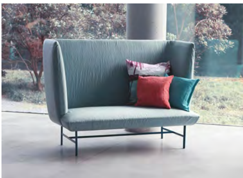
Möbel by Diesel: Sofa „gimme shelter“ in Trendfarbe

wohlich +++ fließende Übergänge zwischen Küche, Bad und Schlafzimmer +++ viel Holz +++ kluge und innovative Trenn-Elemente für Sicht- und Dampfschutz +++ Waschmaschine und Trockner in Schrankeinbauten