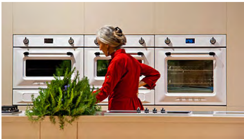
Küchenwand als Funktionsbereich