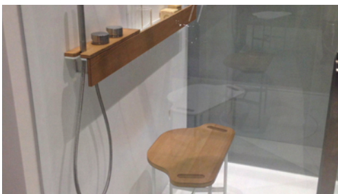
Holz im Bad – als Möbel oder Accessoire

eher Koch- und Arbeitsraum als Prestigeobjekt +++ großer Arbeits-/Kochblock als Zentrum +++ Wände als Stau- und Funktionsbereiche mit offenen Regalen +++ hochwertige Küchengeräte nicht mehr sichtbar, sondern in Einbauten