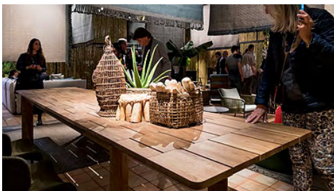
Hölzer mit markanter Haptik